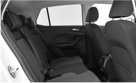
Volkswagen Zentrum München Frankfurter Ring