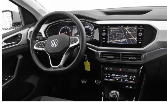
Volkswagen Zentrum München Frankfurter Ring