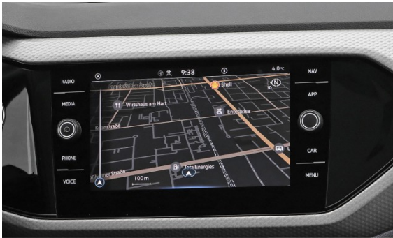
Volkswagen Zentrum München Frankfurter Ring