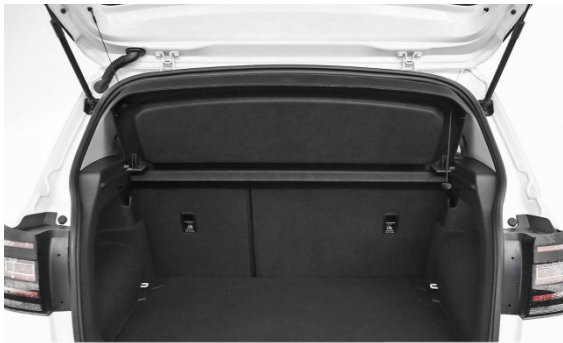
Volkswagen Zentrum München Frankfurter Ring