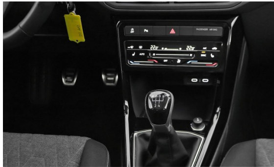
Volkswagen Zentrum München Frankfurter Ring