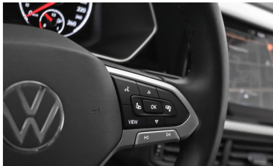
Volkswagen Zentrum München Frankfurter Ring