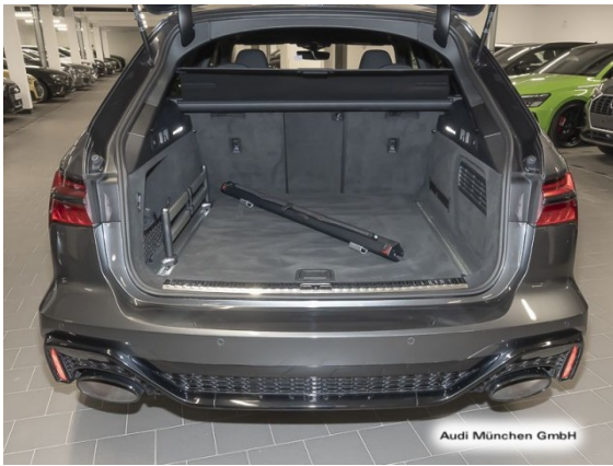
Audi München GmbH